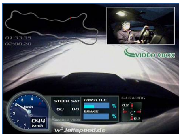
Video VBOX Lite の画面レイアウトのサンプル 上のレイアウトでは速度、G フォース、コース上の位置が GPS からの情報として配置されています。

Video VBOX Lite は、最大 2 つカメラ入力を備えています。カメラは防水対策が施されていて、取り込まれる 2 つの映像を画面上で重ね合わせて自由に配置することができます。